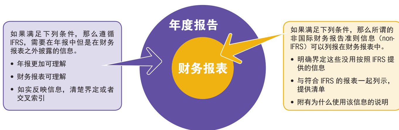
讨论稿中信息位置的原则图